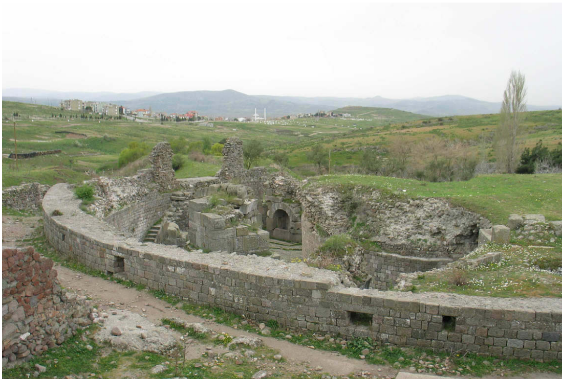
Abb. 44: Inkubationsräume

In der ebenfalls mit Marmor ausgestatteten Bibliothek konnten die Patienten ihre Mußestunden genießen. Das Publikum bestand aus Patienten mit einer gewissen Finanzkraft, aber auch aus „verrückten Kranken“ (Zitat Herr Pilhofer). Daraus lässt sich schließen, dass die Bibliothek Werke aus allen Sparten der damaligen Literatur enthielt, um jedem Besucher etwas bieten zu können. Auf der anderen Seite des Propylons befindet sich der Zeus-Asklepios-Soter-Tempel, ein Rundbau mit einer Zeus-Kulturnische. Die seltene Kombination von Zeus und Asklepios-Soter ist durch Inschriften belegt. Dieser Tempel hatte eine Kuppel mit einem Loch in der Mitte, durch das sowohl Licht als auch Regenwasser in den Tempel kam. Der Tempel ist erst um 125 n.Chr. erbaut und damit neuer als das eigentliche Heiligtum des Asklepios. Trotzdem gilt er als das Highlight der