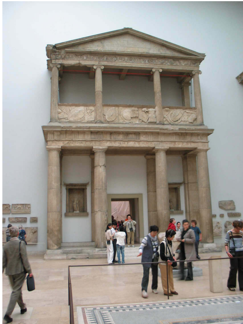
Abb. 52: Propylon zum Athena-Heiligtum