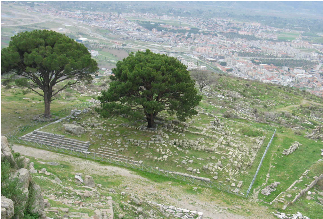
Abb. 49: Fundamente des Großen Altars in Pergamon