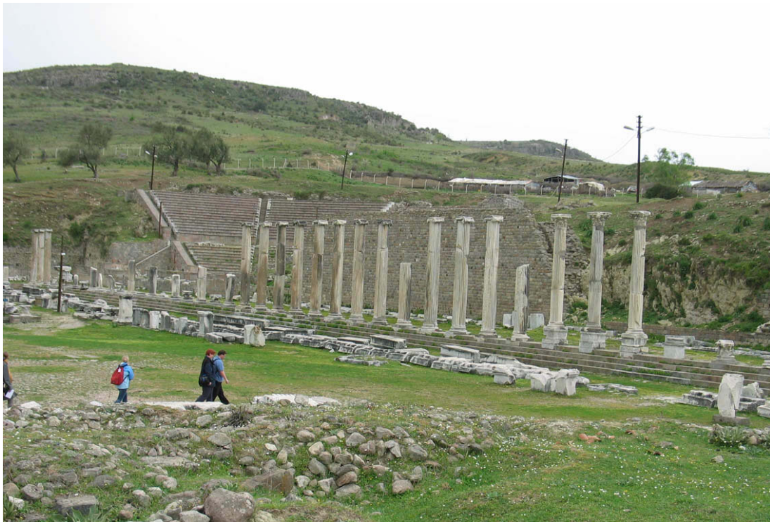
Abb. 45: Blick auf das Theater

Man nimmt an, dass hier das Zentrum des Asklepios-Kultes lag, das Kurzentrum. An diesen Ort begab man sich zum Inkubationsschlaf (Tempelschlaf in der Antike). Dabei erscheint dem Patienten Asklepios im Traum und gibt ihm Anweisungen, wie er seine Krankheit zu behandeln habe ( κατ' ὄνειρον ). Dieser Traum musste am nächsten Tag umgesetzt werden. Beispiele dafür liefert uns Herr Pilhofers besonderer Freund Aelius Aristides, der sechs Bücher mit seinen eigenen Traumerscheinungen und Heilungen gefüllt hat. 4 Es muss hier so eine Art „Zauberbergatmosphäre“ geherrscht haben, einige Fanatiker, zu denen man auch Aelius Aristides, der niemals endgültig geheilt wurde, zählen könnte, waren