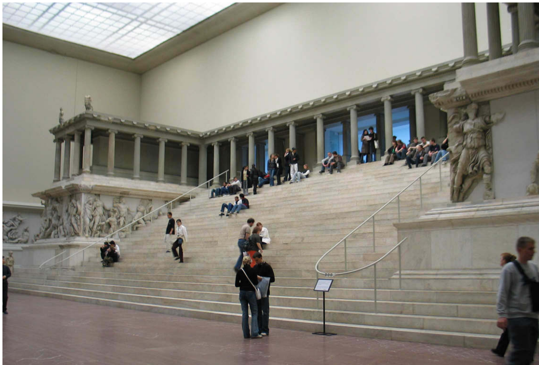
Abb. 50: Großer Altar im Pergamon-Museum in Berlin

Dem großen Altar wurde in diesem Neubau schon allein wegen seiner Größe die zentrale Stellung innerhalb des Museums eingeräumt. Daher bürgerte sich bald die Bezeichnung „Pergamonmuseum“ für das Museum und „Pergamonaltar“ für den Altar ein. Zunächst kommen wir in einen Vorraum, wo Audio-Guides kostenlos zur Verfügung stehen. Unserer Meinung nach stellen sie sich bei den großen Ausstellungstücken als durchaus hilfreich heraus. Die Ausstellung ist an sich sehr gut beschildert und beschrieben, was die wichtigsten Gegenstände betrifft. Handreichungen zu den Hauptattraktionen können gegen 0,10 bzw. 0,20 Euro mitgenommen werden. Es ist also für den Laien nicht nötig eigene Literatur mitzubringen. Nach diesem Vorraum kommt man direkt in den besagten zentralen Saal mit dem großen Altar.