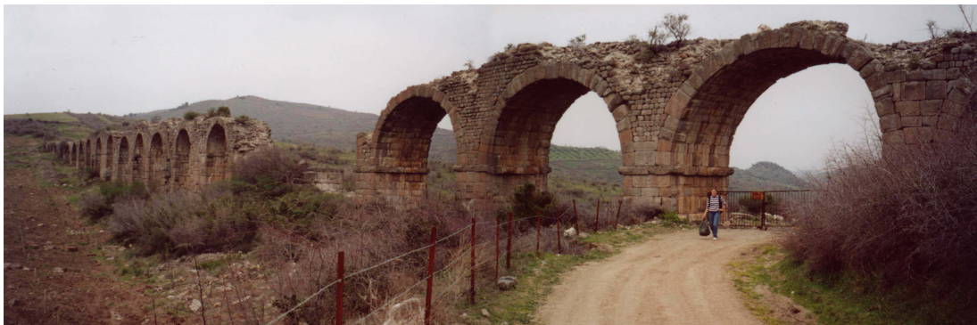
Abb. 42: Aquädukt bei Pergamon

Unserem Ziel steht nun endgültig nichts mehr im Weg. Lediglich ein etwa 100 m langer, sehr steiler Anstieg mit gelegentlichem Steinfall, – was aber ja eh nur für die Hinterherlaufende von erinnerungswürdigem Wert ist – und ein Zaun, über den wir klettern müssen, wobei man auch ohne Probleme seine neue Jeans beschädigen kann. Aber dann ist das Ziel, nämlich das antike Aquädukt aus der Nähe betrachten zu können, erreicht und die Freude groß.