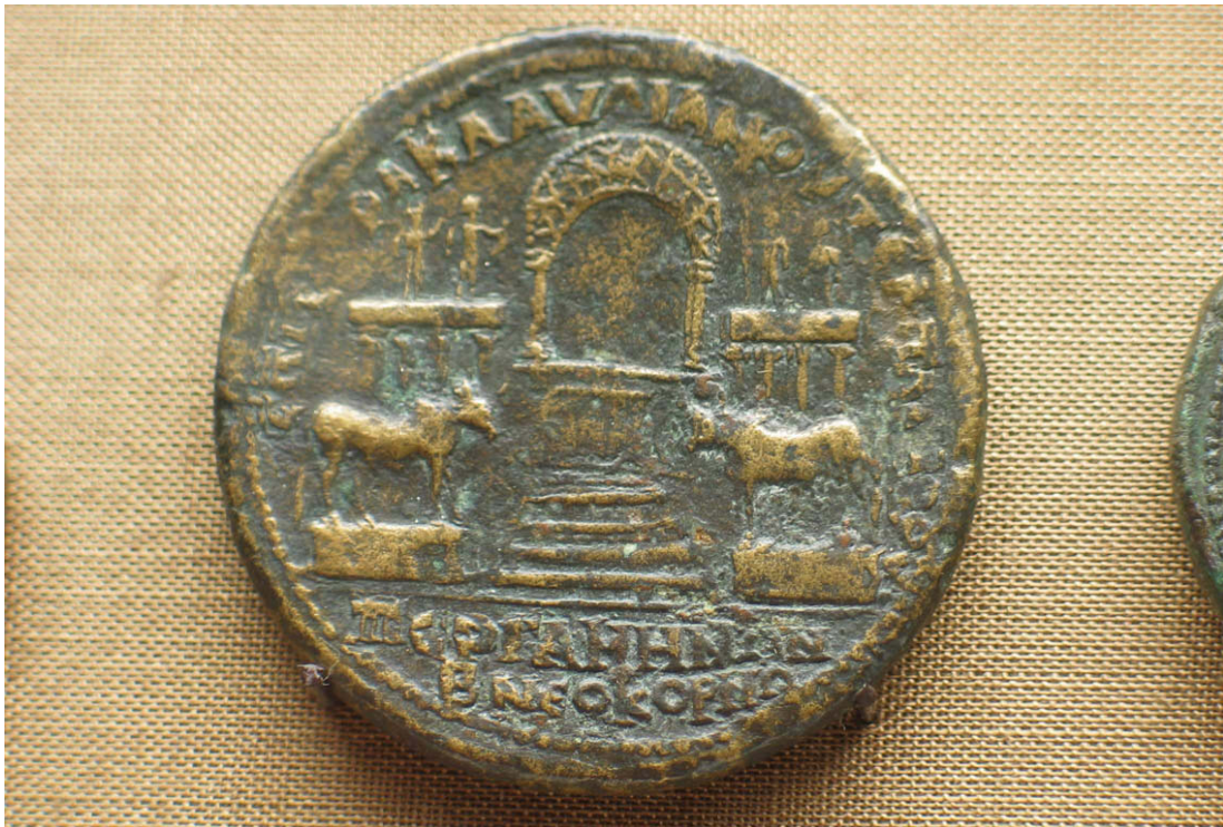
Abb. 51: Kaiserzeitliche Münze mit der Front des Großen Altars

ge Weihinschrift ist nicht gefunden worden. Zwei Fragmente bieten immerhin die wichtigen Worte: „(der) Königin“ und „(für) . . . Wohltaten“. Außerdem wurde die Ausrichtung des Altars auf den oberhalb liegenden Athena-Tempel sowie besonders herausragende Kampfgruppen von Zeus und Athena im Ostfries festgestellt. Aus diesen Informationen und aus dem Vergleich mit anderen pergamenischen Weihinschriften erschließt man eine Inschrift, „nach der König Eumenes, Sohn des Königs Attalos und der Königin Apollinis den Altar für erwiesene Wohltaten dem Zeus und der siegesbringenden Athena geweiht hätte“ 4 . Im Innenhof des Altars befand sich der Opferplatz, der aus einem großen rechteckigen Podium bestand. Die antiken Belege für den großen Altar sind nur in sehr überschaubarer Zahl vorhanden. Sehenswert ist eine Bronze-Münze aus der Zeit des Kaisers Septimius Severus (193–211 n.Chr.), auf der die Front des Altars und ein archäologisch nicht mehr identifizierbarer gewölbter Überbau über dem Opferplatz zu sehen ist.