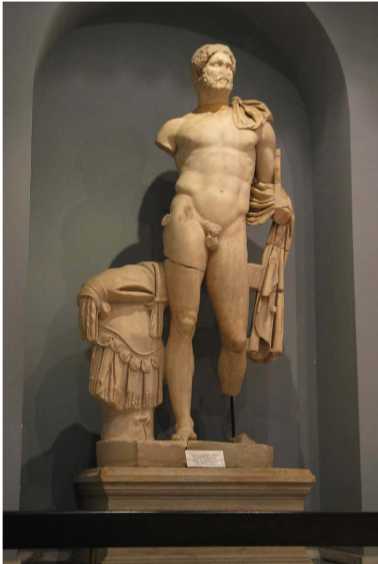
Abb. 47: Statue des Kaisers Hadrian

dieser Art im römischen Reich vorhanden war. VIII Rings der Wände befanden sich Nischen mit Regalen für Buchrollen, die wahrscheinlich mit Holztüren verschlossen werden konnten. Gegenüber dem Eingang stand in einer Nische die Statue des Kaisers Hadrian, die heute im Museum von Bergama zu bewundern ist. Flavia Melitine hat sie „dem Gott Hadrian“ geweiht. IX