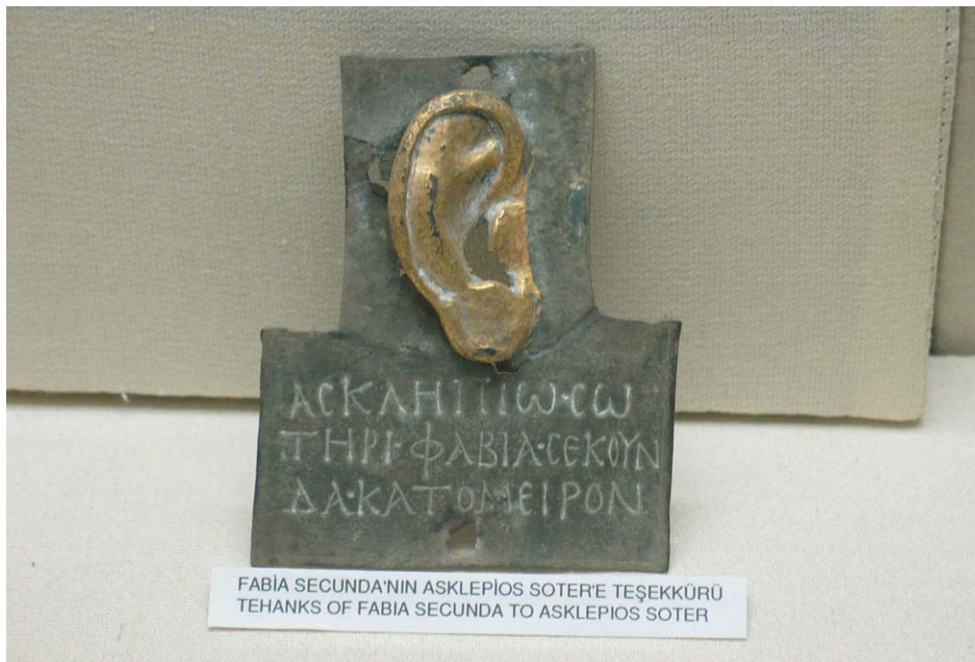
Abb. 43: Ein Ohr für Asklepios

Die Besucher wenden sich nun den Weihungen des Asklepios zu. So wurden Körperteile in Ton (Massenproduktion) oder Metall (individuelle Anfertigung) dem Gott, der auch den Beinamen σωτήρ trug, als Dank für die Heilung derselben geweiht. Diese wurden dann im Heiligtum aufgestellt, um den Ruhm des Gottes zu vermehren.